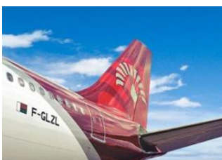
Paris Roissy CDG 📍