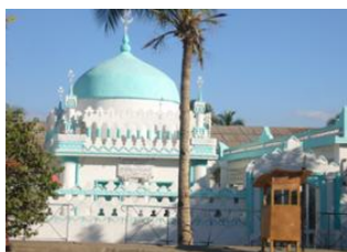
Majunga ✈️ 400km - 🕒 1h Antananarivo