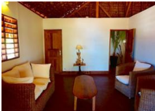
EcoLodge des Terres Blanches 📍