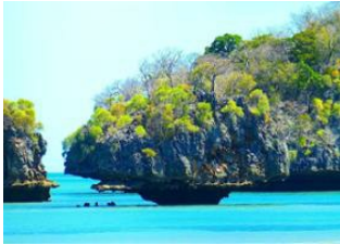
EcoLodge des Terres Blanches 📍 📍 45km - ⌚ 2h 30m Baie de Moramba 📍