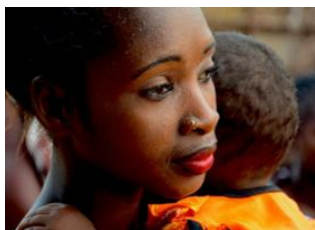
EcoLodge des Terres Blanches