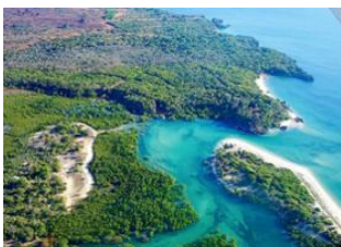
EcoLodge des Terres Blanches 📍