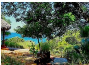
Baie de Moramba 📍 📍 45km - ⌚ 2h 30m EcoLodge des Terres Blanches 📍