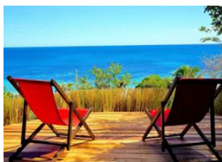
EcoLodge des Terres Blanches 🚗 120km - 🕒 10h Majunga