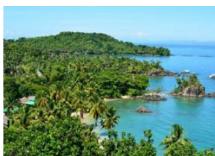
Tamatave 🚗 90km - ⌚ 3h Mahambo 🚗 - ⌚ 3h Île Sainte Marie