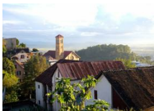
Ile Sainte Marie 📍 ✈️ 500km - ⌚ 1h Antananarivo 📍