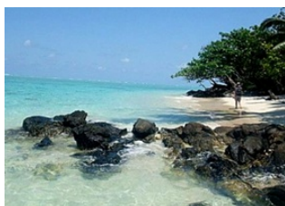
Ile Sainte Marie 📍