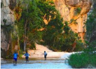
Ampandramaneno 📍 21km - ⌚ 8h