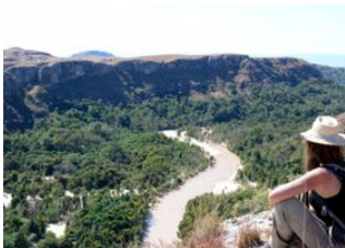
Sakamaly 📍 18km - ⌚ 6h Sakapaly Ambony 📍