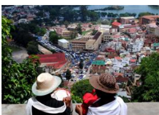
Antananarivo 📍 10km - ⌚ 4h