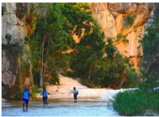
Ampandramaneno 📍 21km - ⌚ 8h Sakamaly 📍