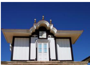
Paris Roissy CDG 📍 ✈️ 8500km - ⌚ 10h Antananarivo 📍