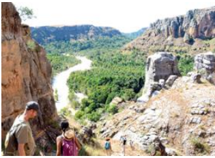
Sakamaly 📍 18km - ⌚ 6h Sakapaly Ambony 📍