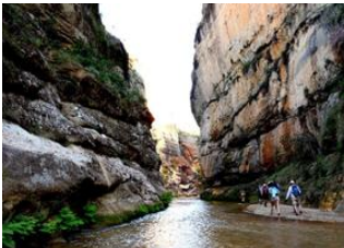
Ampandramaneno 📍 21km - ⌚ 9h Sakamaly 📍