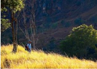
Janjy 📍 18km - ⌚ 8h Ampandramaneno 📍