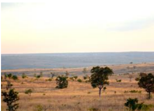
Manampanda 📍 14km - ⌚ 6h Tsiazorambo 📍