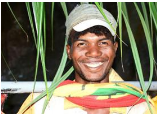
Sakapaly Ambony 📍 14km - ⌚ 8h Manampanda 📍