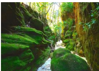
Sakapaly 📍 12km - ⌚ 5h Ampasimaiky 📍