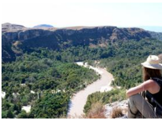
Sakapaly 📍 12km - ⌚ 4h Sakapaly 📍