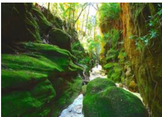
Sakapaly 📍 12km - ⌚ 5h Ampasimaiky 📍