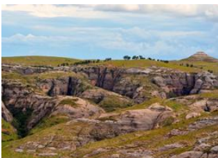
Manampanda 📍 8km - 🕒 3h 30m Tsiazorambo 📍 🚗 30km - 🕒 2h Malaimbandy 📍 🚗 115km - 🕒 2h 30m