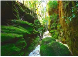
Ampasimaiky 📍 16km - 🕒 6h Sakapaly 📍