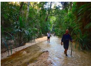
Sakapaly 📍 15km - 🕒 6h Manampanda 📍