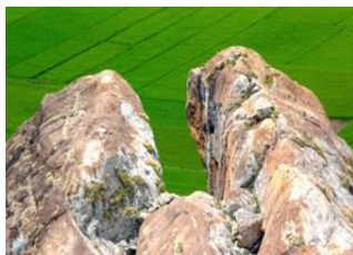
Ambatomalaza 📍 12km - ⌚ 4h Antsahadinta 📍