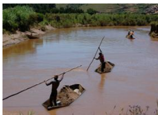
Antsahadinta 📍 7km - ⌚ 2h 30m Vontovorona 📍 🚶 4km - ⌚ 45m Alakamisy 📍 🚗 25km - ⌚ 1h 30m Antananarivo 📍