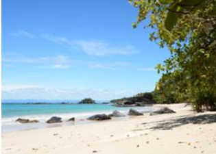
Ambodiforaha 📍 🚤 40km - ⌚ 1h 30m Maroantsetra 📍