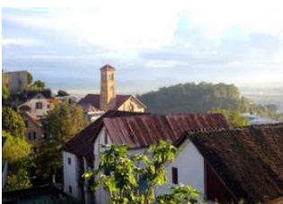
Antananarivo 📍 ✈️ 8500km - ⌚ 10h