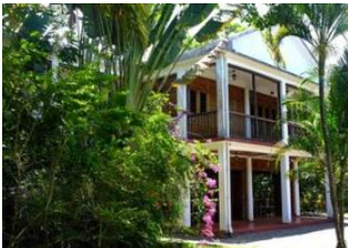
Maroantsetra 📍 ✈️ 740km - ⌚ 1h 30m Antananarivo 📍