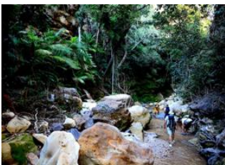
Sakapaly 📍 19km - ⌚ 7h Manampanda 📍