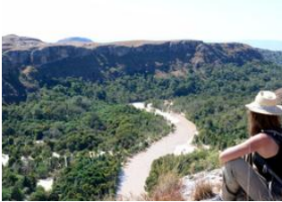
Sakamaly 📍 18km - ⌚ 6h Sakapaly 📍