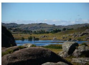
Grande vallée 📍 17km - ⌚ 5h Les lacs 📍