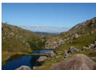
Les lacs 📍 10km - ⌚ 4h